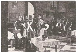
Mesón "el catalán"

Zaragoza 1808. La ciudad está siendo sitiada Napoleón mientras en "El Catalán", el mesón más famoso tropas españolas descansan. En él se hospeda el alférez dos hijos, Santica y Juanito, y el cura de la iglesia de San mesón, llamada Agustina, destaca por su amabilidad en el españoles. Una noche, el alférez es avisado para filas y deja a sus hijos a cargo de Agustina. Los franceses Zaragoza, pero la celebración en "El Catalán" se ve la muerte del alférez. En una refriega, resulta herido un que es recogido por Santica. Ésta se enamora de él. descubre al herido, reprende a Santica, ya que pueden traición. El teniente se recupera y, aunque está enamorado que su deber es luchar con los suyos; escapa, pero Juanito, es encarcelado. En el asalto al Portillo, Juanito y por las balas, y, en un acto de heroísmo Agustina sustituye cañón e impide que el enemigo penetre en la ciudad. Por condecorada por el general Palafox. Santica aprovecha de guardia en el penal y trata de que ésta interceda por el deja en libertad a Duval y se en su lugar. Santica y el del cerco de la ciudad, pero no facilitar información a su bandos se desarrollan Agustina y el de Duval. absueltos. Al final, Zaragoza francés, pero los jóvenes se casan. 1